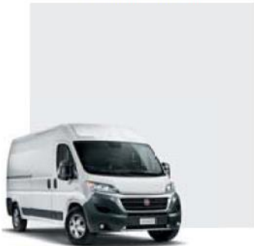
549 Bianco Ducato