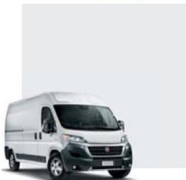
549 Bianco Ducato