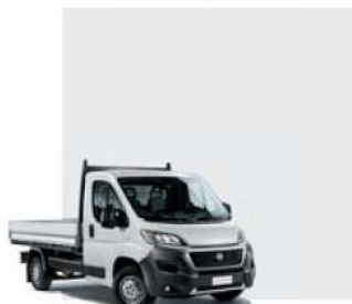
549 Bianco Ducato

Забарвлення кузова пастельною фарбою (колір білий)